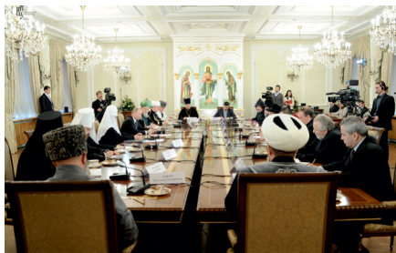
1. Встреча председателя Правительства РФ В.В. Путина со Святейшим Патриархом Кириллом и руководителями традиционных религиозных общин России, февраль 2012. На фото: Святейший Патриарх Московский и всея руси Кирилл, председатель Правительства РФ В.В. Путин: «Не могу не поддержать предложение Патриарха Московского и всея руси Кирилла об организации центров поддержки семьи в каждом городском округе и муниципалитете».