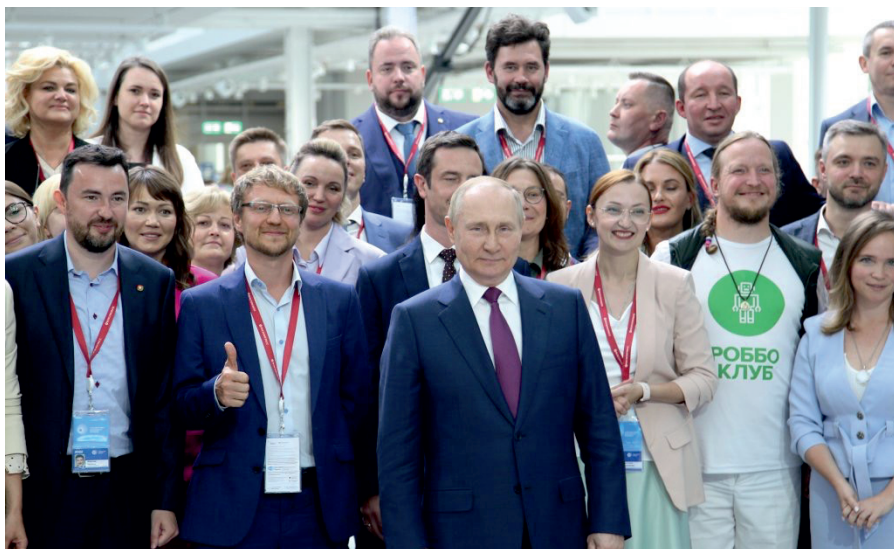
15. Форум сильных идей АСИ, июль 2022 На фото: Президент Российской Федерации Владимир Путин, президент АНО «Святые Покрова» Светлана Черенкова, лидеры Top-11 и Top-100 Форума «Сильные идеи для нового времени» АСИ