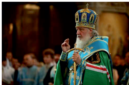
2. Молебен в Храме Христа Спасителя перед началом II Съезда руководителей епархиальных отделов социальной направленности на тему «Помощь семье как сфера ответственности Церкви и государства», июль 2012 На фото: Святейший Патриарх Московский и всея руси Кирилл