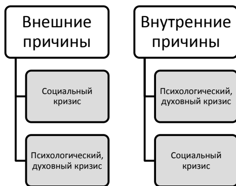
Рис. 1. Возникновение и развитие семейных кризисов.

Социальный кризис вызывается внешними причинами – событиями, имеющими место вне семьи и ведущими к изменению материального положения и/или социального статуса семьи (утрата работы, жилья, документы, средств к существованию и т.д.). Социальный кризис нередко порождает психологический либо духовный кризис (пересмотр ценностных основ семьи, конфликты). Психологический либо духовный кризис могут явиться следствием внутренних причин (изменение состава семьи, взросление детей, развод, болезнь, смерть кого-либо из членов семьи, супружеская измена). В этом случае психологический либо духовный кризис могут привести к изменению материального положения либо социального статуса семьи (рис. 1).